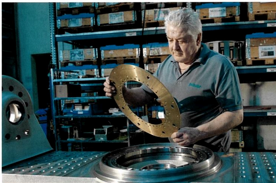
1 Ein Peiseler-Mitarbeiter bei der Montage einer Zweiachs-Schwenkeinrichtung, die zu den Top-Produkten des Unternehmens gehört

Für das Unternehmen mit Stammsitz Remscheid, einem weiteren Werk in Mortara, einer USA-Niederlassung in Grand Rapids und Vertretungen in zahlreichen Ländern ist Positionier-Technologie eine der wichtigsten Grundlagen für den Erfolg. Die Positionier- und Teilgeräte erreichen mit bis zu einer Winkelsekunde eine extreme Genauigkeit. Das entspricht etwa dem Durchmesser eines Haares, unter dem eine 1-Euro-Münze aus der Luft auf eine Entfernung von 4800 Metern erscheint. »Man stelle sich vor, auf der ausgetreckten Handfläche steht ein 27 Tonnen schwerer Sattelzug, es dann gilt festzuhalten, ohne die Position des Armes um weniger als ein Zehntel der Länge eines Haares zu verändern«, veranschaulicht