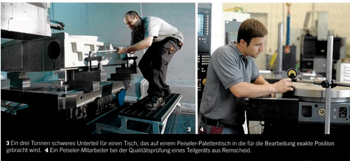
3 Ein drei Tonnen schweres Unterteil für einen Tisch, das auf einem Peiseler-Palettentisch in die für die Bearbeitung exakte Position gebracht wird. 4 Ein Peiseler-Mitarbeiter bei der Qualitätsprüfung eines Teilgeräts aus Remscheid.