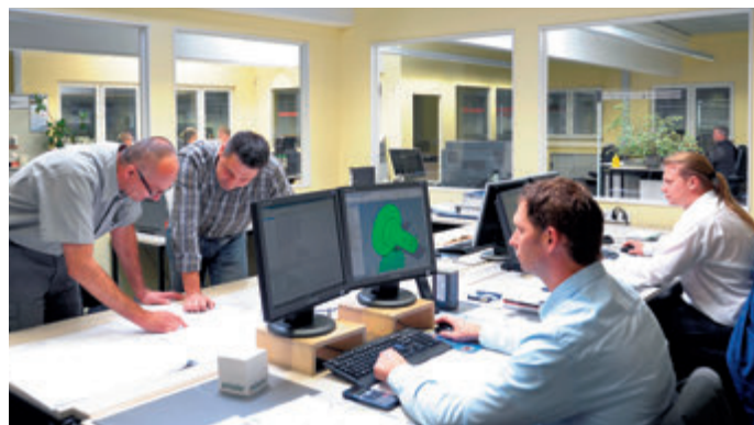
Auftragszentrum bei Peiseler in Remscheid, in dem die detaillierte Planung der Produktion erfolgt.

Für die unterschiedlichsten Bearbeitungen von Werkstücken bietet Peiseler ein breites Portfolio an. Das Standardprogramm um-