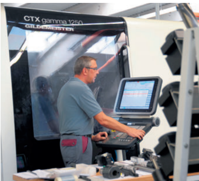
Montage einer Sonderkonstruktion, die auf den individuellen Kundenbedarf ausgerichtet ist.

Neben dem Hauptgeschäft der Erstausrüstung von Kunden, die mit ihren Werkzeugmaschinen Lösungen für den Automobilbau, die Energietechnik und Luftfahrt, aber auch die Präzisionsfertigung, Medizintechnik und Werkzeugtechnik sowie den Formenbau anbieten, spricht Peiseler seit kurzem auch die Endkunden direkt an. Vor allem für kleinere Unternehmen, die bislang Geräte mit drei linearen Achsen eingesetzt haben, hat Peiseler die neue ATC-Baureihe auf den Markt gebracht. Diese ermöglicht die Nachrüstung um zwei rotative Achsen und damit fünfachsiges Anwendungen. Aber auch Kunden, die nicht über das erforderliche Know-how oder die entsprechenden Maschinen verfügen, sind für Peiseler interessant. Ihnen bietet das Unternehmen eine Lohnfertigung und die Produktion auf den eigenen Anlagen an.